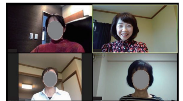
▲オンラインセミナーの様子

詳しくは各教室担当に直接お問い合わせいただくか、フリーダイヤルにお問い合わせください！